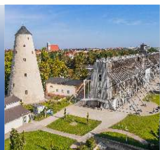
Eingang zur Inhalation